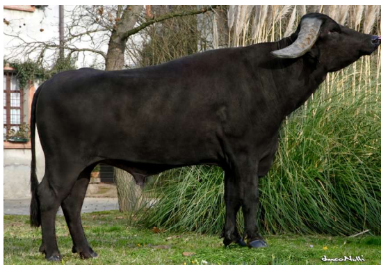
O-B ONE padre di BATIMAN